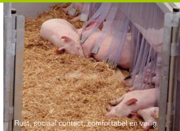
Rust, sociaal contact, comfortabel en veilig