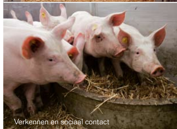
Verkennen en sociaal contact