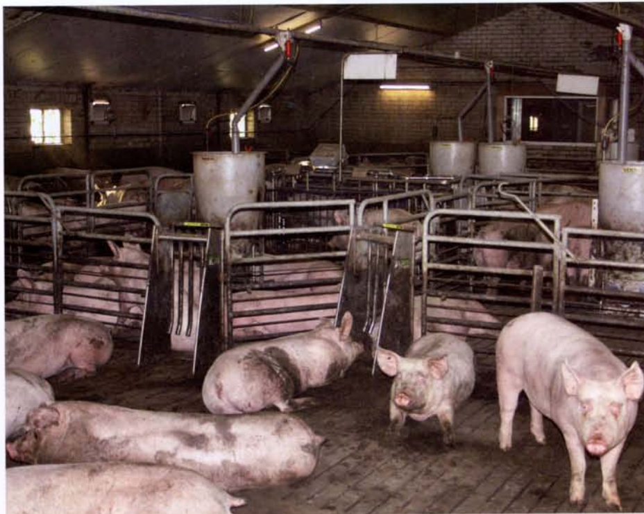
In een grote groep houdt Nicky Sanders 320 vleesvarkens. Het systeem bevalt zo goed dat hij zijn nieuwe stal ook met grote groepen gaat uitvoeren.

Het poortje waarlangs de varkens de voerruimte verlaten moet zodanig zijn dat de varkens er niet mee spelen en er zeker geen varken terug kan lopen.